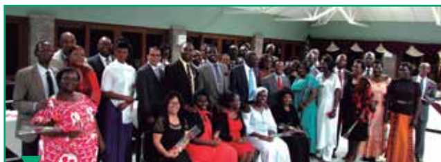
Les femmes de pasteur de cette division ont planifié un banquet à l'intention de leurs époux pour leur signifier leur soutien dans le ministère.

En mars, la division a démarré un programme de formation continue. En avril, elles ont organisé un banquet à l'intention de leurs maris afin de leur exprimer leur soutien total dans le ministère. Ensemble, ils ont passé du temps en prière, ont chanté et se sont encouragés mutuellement. Les pasteurs ont été extrêmement heureux et ont demandé quand aurait lieu le prochain événement !