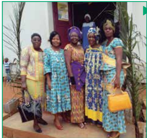
En Mars, les coordinatrices Shepherdess de l'Union des missions du Cameroun ont organisé une retraite spirituelle au centre Ayos situé dans la fédération du sud.

L'Union des missions du Cameroun a présenté lors des réunions consultatives de la Division de l'Afrique centrale et occidentale certains projets menés par les femmes de pasteur du Cameroun.