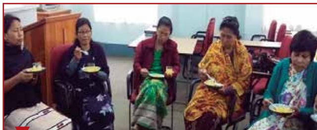
La journée des femmes de pasteur a également été célébrée dans l'Union du Nord-Est de l'Inde.