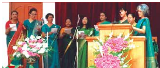
La journée des femmes de pasteurs célébrée dans les locaux de la Division de l'Asie du sud.