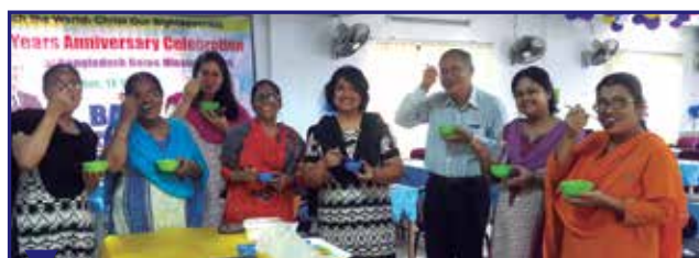
Les femmes de pasteur savourant une glace après une session de travail.