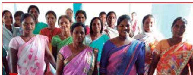
Les femmes de pasteur de l'Union du nord de l'Inde se sont aussi réunies en ce jour spécial.