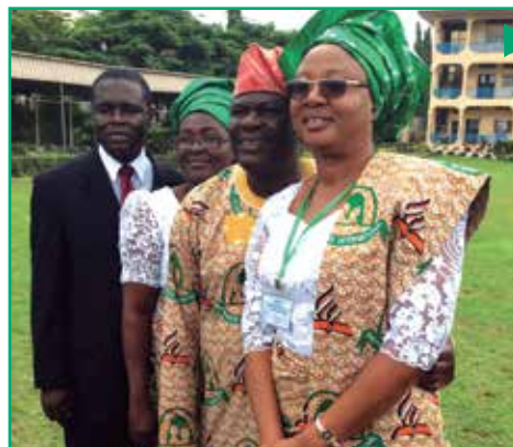
Le secrétaire de l'association pastorale de cette division et la coordinatrice Shepherdess en compagnie du président de l'Union de Nigeria de l'ouest et de la coordinatrice Shepherdess de cette union.

Cette division a tenu des réunions consultatives en août 2016 à Abidjan. Des responsables de l'association pastorale de la Conférence Générale ont animé ces rencontres.