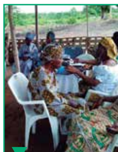
Durant la convention à l'Université Babcock, un contrôle médical gratuit a été offert à la communauté.