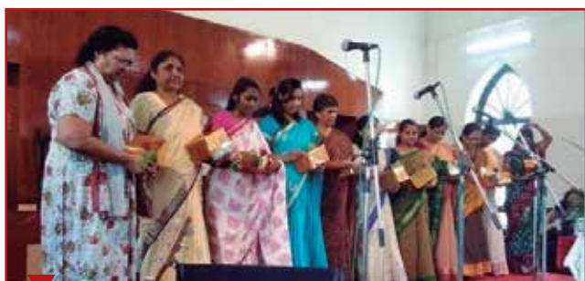
Les femmes de pasteur de l'Union de l'ouest de l'Inde ont présenté un programme spécial.