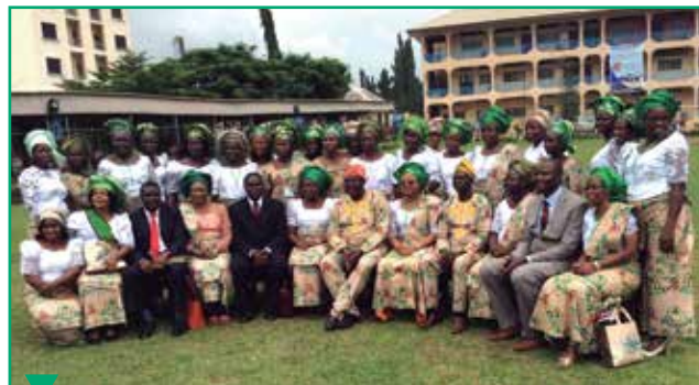
Les dirigeants de l'Union de Nigeria de l'ouest ont rencontré les coordinatrices des champs.

L'Union des fédérations du Nigeria de l'ouest a organisé une convention en août 2016, à l'Université Babcock. Le thème était « Armée pour le ministère en équipe » et plus de 200 femmes de pasteur ont répondu présentes. Elles ont fait des projets pour organiser un congrès pour les enfants de pasteurs, pour former les diacres et les diaconesses en 2017, et pour encourager chaque fédération locale à organiser une retraite pastorale chaque deux ans. Les autres projets pour l'avenir sont : partager la prière et les textes bibliques grâce aux textos, créer une chaîne de prière parmi les coordinatrices, visiter les orphelins et les défavorisés, et enfin, visiter les femmes de pasteur à la retraite et leur offrir un présent.