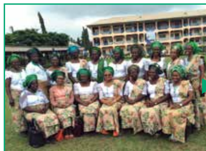
Les coordinatrices ont rencontré celles venues des unions et de la division au siège social de cette division.

L'Union des fédérations du Nigeria de l'ouest a organisé une convention en août 2016, à l'Université Babcock. Le thème était « Armée pour le ministère en équipe » et plus de 200 femmes de pasteur ont répondu présentes. Elles ont fait des projets pour organiser un congrès pour les enfants de pasteurs, pour former les diacres et les diaconesses en 2017, et pour encourager chaque fédération locale à organiser une retraite pastorale chaque deux ans. Les autres projets pour l'avenir sont : partager la prière et les textes bibliques grâce aux textos, créer une chaîne de prière parmi les coordinatrices, visiter les orphelins et les défavorisés, et enfin, visiter les femmes de pasteur à la retraite et leur offrir un présent.