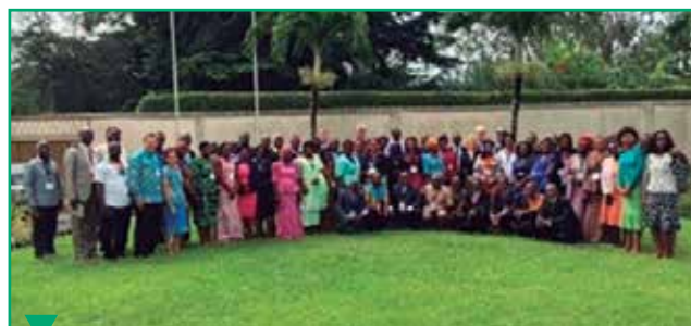
Les responsables de l'association pastorale et les responsables Shepherdess de cette division se sont rencontrés à Abidjan.

Cette division a tenu des réunions consultatives en août 2016 à Abidjan. Des responsables de l'association pastorale de la Conférence Générale ont animé ces rencontres.