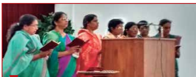
Les femmes de pasteur de l'Union du sud-est de l'Inde ont participé au programme.