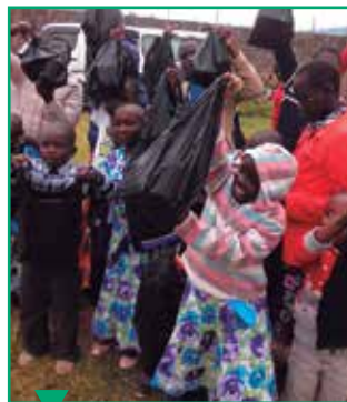
Les enfants laissent éclater leur joie en recevant les cadeaux offerts par les femmes de pasteur.