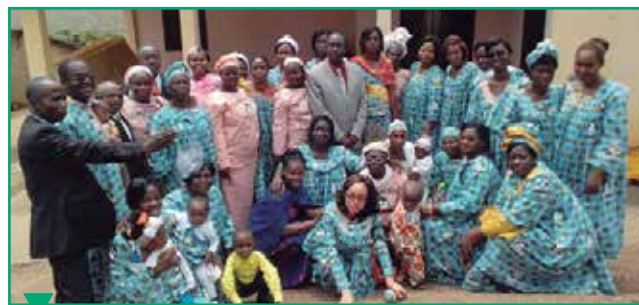
La retraite spirituelle Shepherdess à Bertoua, dans la fédération de l'est, s'est tenue du 20 au 24 juillet.