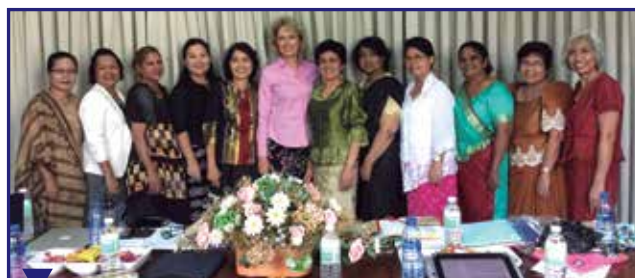
Les coordinatrices Shepherdess de l'Union du nord des Philippines.