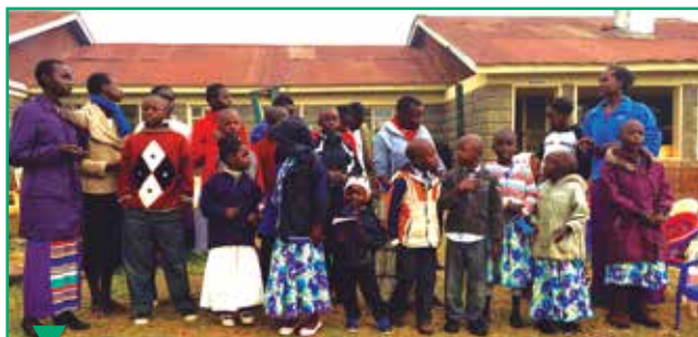
Des enfants orphelins chantent pendant le moment d'adoration, debout devant l'orphelinat.

Ces femmes de pasteur ont trouvé divers moyens de participer à l'action « Engagement total du membre ». Lorsque vous êtes prêts, Dieu lui-même vous dirige et il y a de la joie à s'engager pour le Maître.